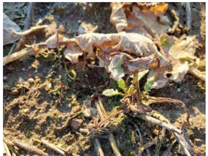
Stark geschädigte Einzelpflanze durch Erdflorbefall.