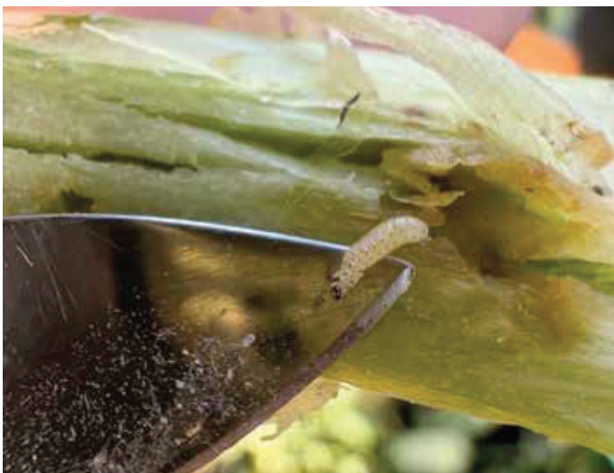
Während ihrer Entwicklung verlassen die Erdflorlarven das Innere der Rapspflanze und kommen an die Oberfläche.

Der zweite Züchtungsansatz bezieht sich auf die Larven des Erdflors. Rapssorten mit reduzierter Anfälligkeit weisen weniger Larven auf, zudem kann die Fraßaktivität verringert sein und die Larven können eine verzögerte Larvenentwicklung zeigen. Dies kann mit der Berlese-Methode überprüft werden, die sich in internen Versuchen als die genauere Methode erwiesen hat. Bei der Berlese-Methode werden die Pflanzen in einen Trichter gelegt, der wiederum über einer Fanglösung platziert ist. Nach 14 bis 21 Tagen verlassen die Larven die Blattstiele. Durch ihren Instinkt, in den Boden zur Verpuppung abzuwandern, landen sie in dem Behältnis mit der Fanglösung unter dem Trichter. Die Bestimmung des Larvenstadiums ist bei dieser Methode zwar möglich, aber weniger genau, da sich die Larven in der Pflanze weiterentwickeln können. Das ist jedoch von verschiedenen Faktoren abhängig. Wenn die Pflanzen bei warmen und trockenen Bedingungen sehr schnell austrocknen, findet keine weitere Entwicklung der Larven statt. Ist es kühler und feuchter,