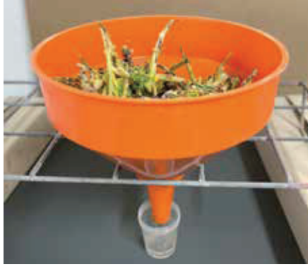
Bonitur nach Berlese.

Das Wissen der letzten Jahre können Landwirte bei ihrer Anbaustrategie berücksichtigen. In Regionen mit jährlichem Erdflöhbefall sollten geeignete Sorten ertragsstark und umweltstabil sein und eine geringe Anfälligkeit gegenüber dem Raps-erdflöhen zeigen. Bei der Beize sollte auf einen Wirkstoff gesetzt werden, der eine Wirkung gegen den Erdflöhen hat. Hier bietet sich derzeit der Wirkstoff Flupyradifurone an, der mit dem Produkt Buteo start angeboten wird. Als Aussaattermin ist ein fünf bis zehn Tage früherer Termin als der ortsübliche geeignet, denn eine kräftigere Raps- pflanze kann die Haupteinwanderung mit dem einhergehenden Lochfraß besser tolerieren und den späteren Minierfraß der Larven besser vertragen. Bei Frühsaaten ist es wichtig, die Bestandsentwicklung gut zu beobachten. Bei kräftigen Beständen sollte die Wachstumsregulierung im Herbst mit