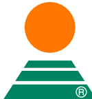
KWS FERRUM (Ährenschieben APS 3)