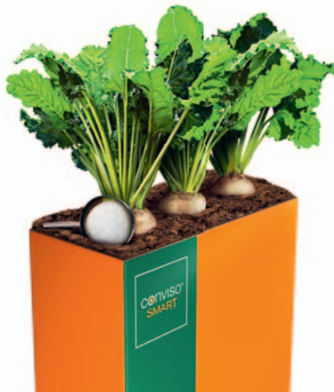
Výsledky SMART ROSSADA KWS, demo pokus Považský cukor, Nové Sady (2021) – % na priemer skúšaných odrôd Porovnanie 31 odrôd, zber 20.10.2021