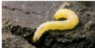
Diabrotica virgifera virgifera LeConte