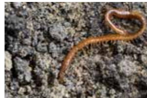
Miriapode (diverse specii)