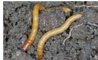
Agriotes spp. (viemele sârmă)