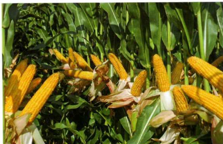
RICARDINIO na polu w Baranówku koło Pleszewa.

Ponieważ dla producenta kukurydzy na ziarno ważne są koszty suszenia, dlatego wyliczyliśmy „dochód brutto”* ze wszystkich odmian w doświadczeniach PDO na północy. I również w tym porównaniu odmiany KWS zajęły czołowe pozycje: 1 miejsce - RICARDINIO , 2 miejsce - LAURINIO , 4 - SILVINIO , a 5 - AMBROSINI .