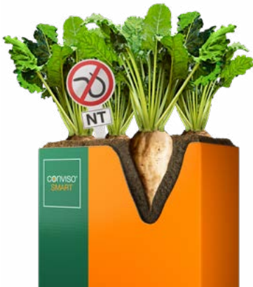
SMART RENJA KWS

SMART RENJA KWS on ankeroisia sietävä lajike hyvällä lehtiterveydellä. Moni suomalainen viljelijä on viljellyt lajiketta onnistuneesti SMART menetelmällä.