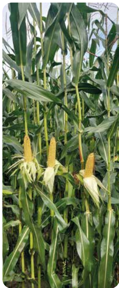
АУТЕНС КВС на легкой почве

При оценке питательной ценности силоса из кукурузы содержание крахмала является важ-